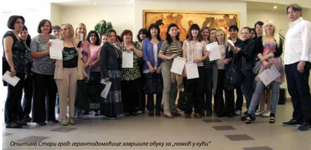
Општина Стари град: геронтодомаћице завршиле обуку за „помоћ у кући“

- Још 2008. уочили смо да је један од већих проблема наше општине немогућност једног броја најстаријих суграђана да правовремено добију не-