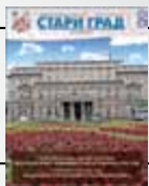
Насловна страна: Стари двор - Скупштина града Београда