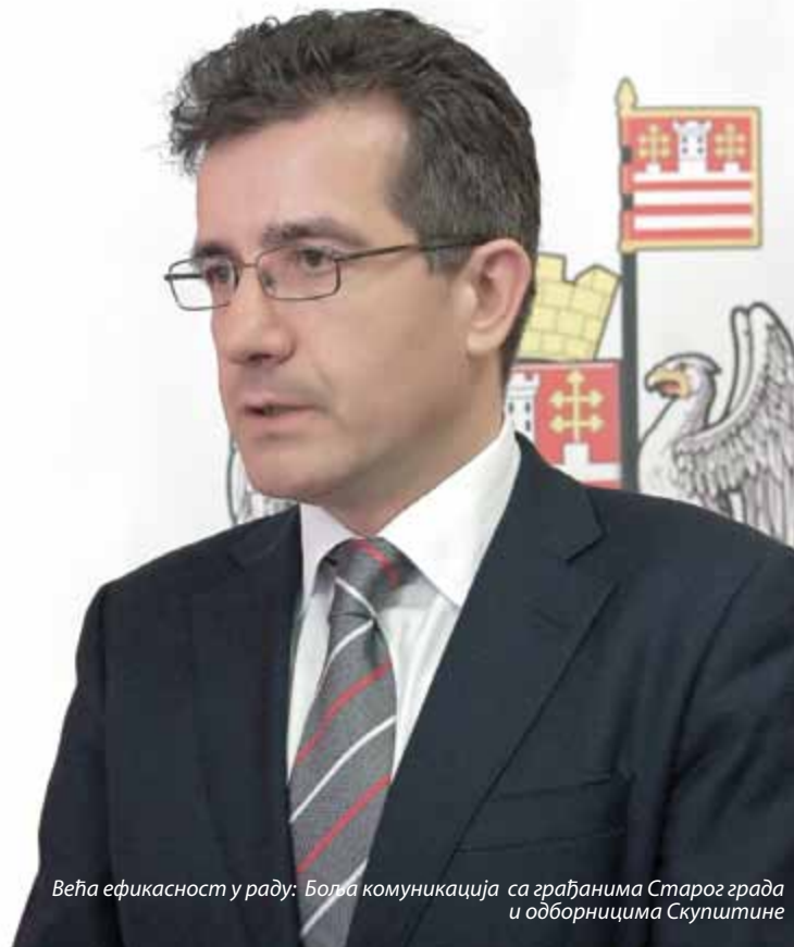
Већа ефикасност у раду: Боља комуникација са грађанима Старог града и одборницима Скупштине

Општина ће и даље наставити са својим традиционалним манифестацијама и акцијама. Наставиће се подршка школама, вртићима и талентованим ученицима, студентима и појединцима, најстаријим суграђанима, особама са инвалидитетом, као и свима