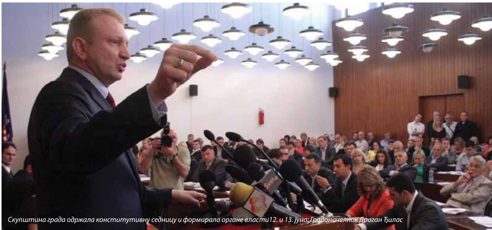
Скупштина града одржала конститутивну седницу и формирала органе власти 12. и 13. јуна: Градоначелник Драган Ђилас