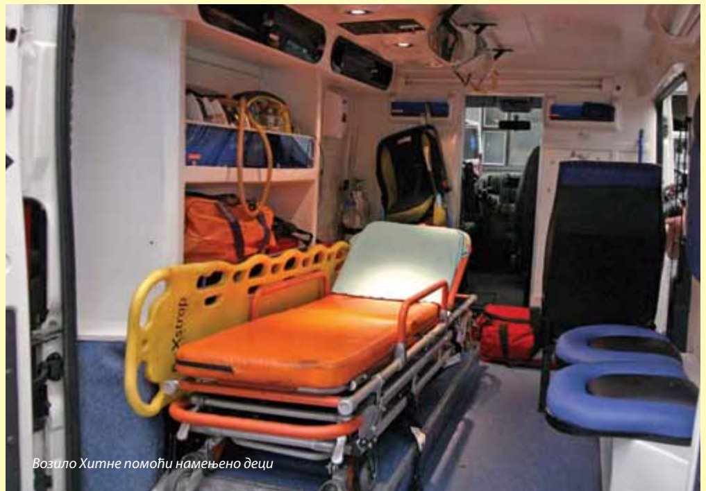
Возило Хитне помоћи намењено деци